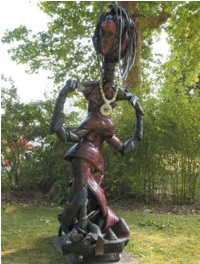
Les œuvres d'Ame ne portent pas de nom, car «Le langage n'entre pas dans mon processus créatif» dit-il.