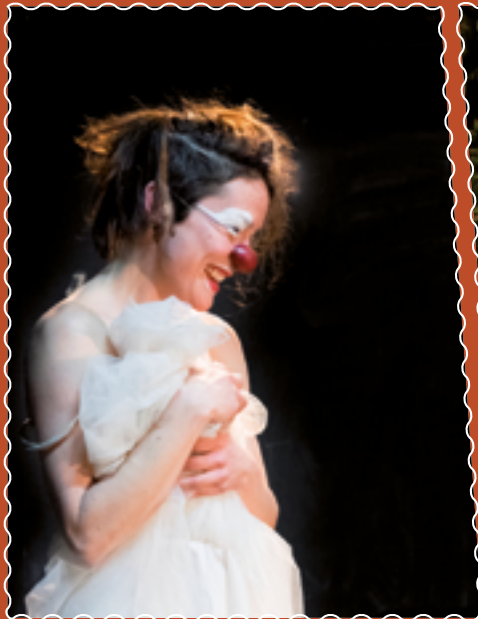
Le 5 avril à l'Espace Culture de la Cité scientifique