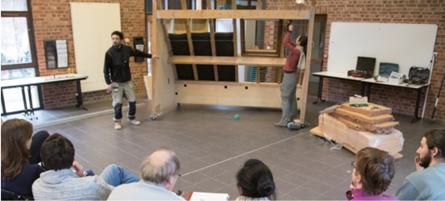
Parmi les nombreux ateliers proposés par le service développement durable, celui consacré à l'isolation des combles fait... toujours salle comble.