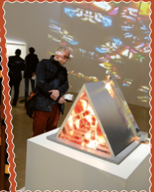
Jusqu'au 20 mai au LaM