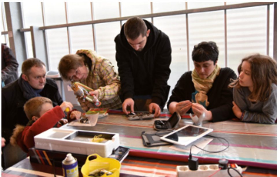
Lors des repair-café (ici, celui consacré aux jeux et jouets, à la Ferme d'en Haut), on échange des savoir-faire, on se conseille, on discute... On repart avec un objet réparé et de nouveaux amis !

L'éclairage public, secteur le plus énergivore de la ville, est un autre point sur lequel l'effort a porté, avec un succès remarquable ! Depuis 2006, 60 % du parc de luminaires ont été renouvelés, et le choix du led et de la variation d'intensité selon la luminosité a permis une baisse de 42 % des consommations en 2015-2016 ! La consommation baissera encore, car le nouveau marché, conclu en avril pour sept nouvelles années, verra la rénovation des 40 % du parc restant.