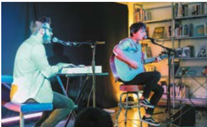
En octobre, le groupe Edgar s'était produit à la médiathèque en «Live entre les livres».

Comme chaque année, la médiathèque met à l'honneur les groupes présélectionnés pour les Inouïs du Printemps de Bourges et comme lors de ce tremplin, il n'en restera qu'un !