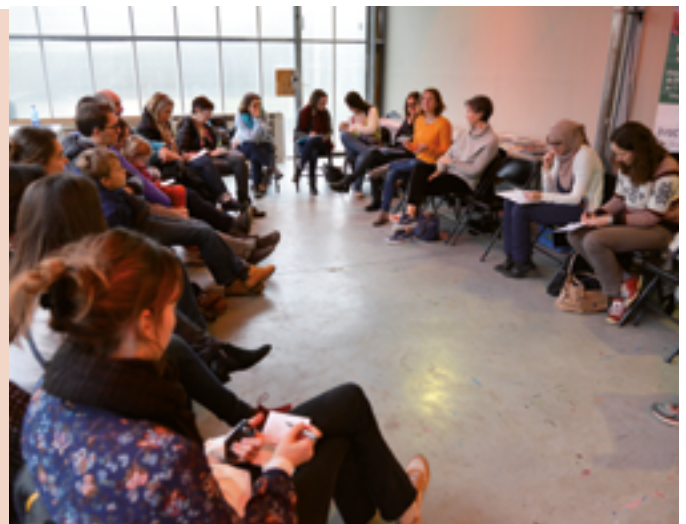
Les participants se retrouvent régulièrement pour faire le point et échanger des pratiques.

Frustré de n'avoir pu vous inscrire ? Le même service propose des ateliers ouverts à tous (voir p. 13).