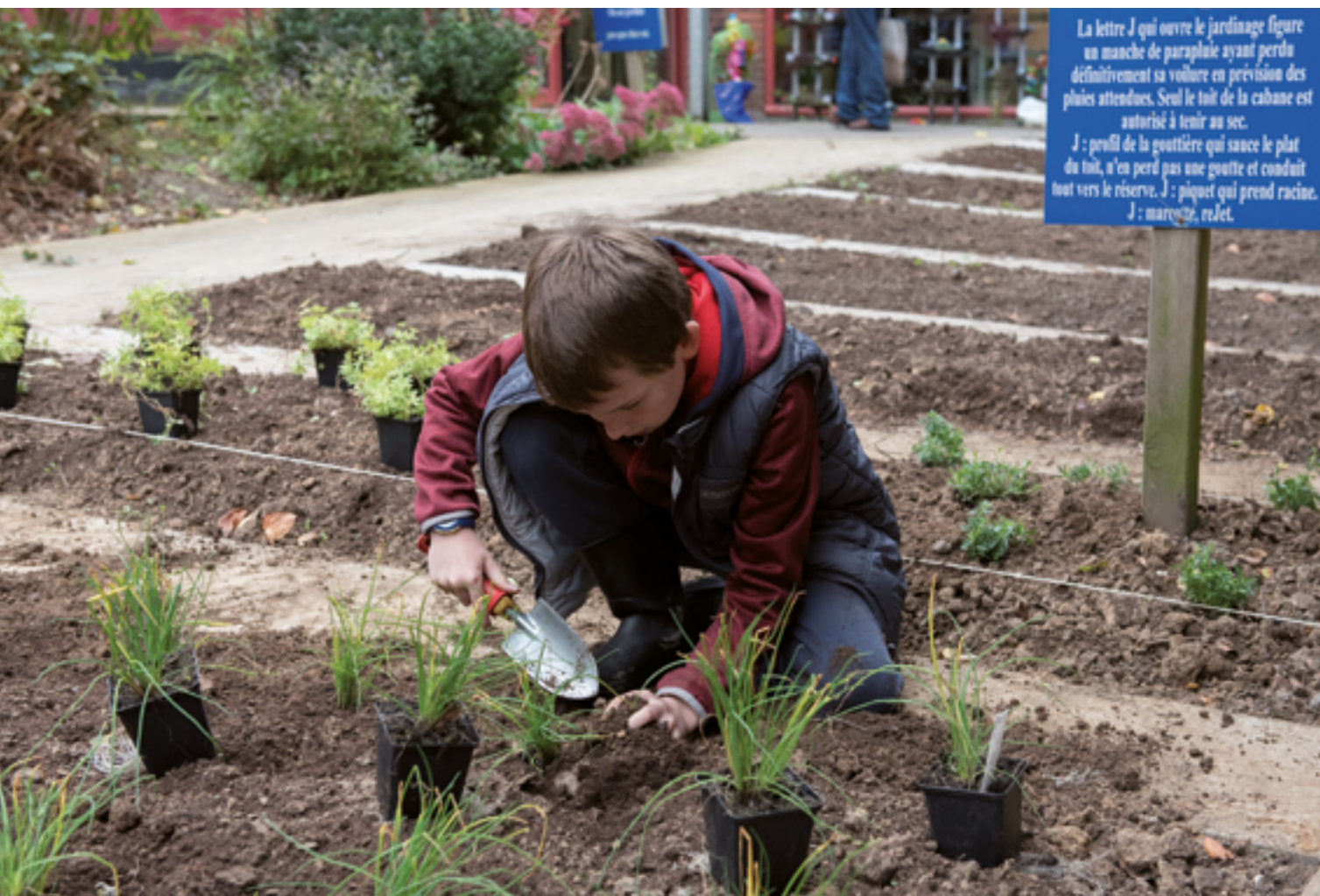
Le projet Carréhaut, à la Ferme d'en Haut, invite à cultiver... un potager, et de bonnes relations de voisinage.