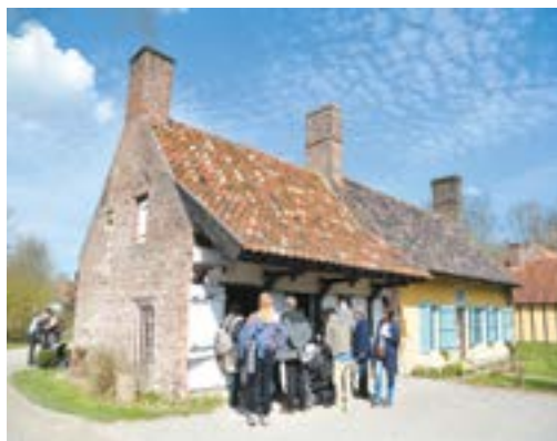
Le musée regroupe 23 bâtiments typiques de l'architecture rurale d'autrefois sauvés de la démolition : fermettes, estaminet, chapelle, forge, chaumière, germoir...

Tél. 03 20 63 11 25 ; museedepleinair.fr