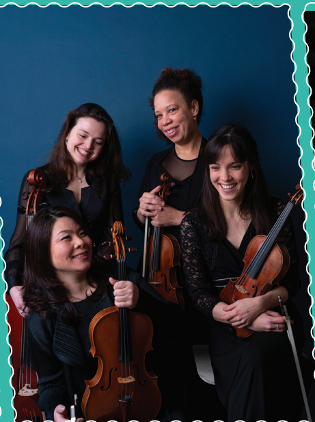
Le 21 janvier à la Ferme en Haut GoYa