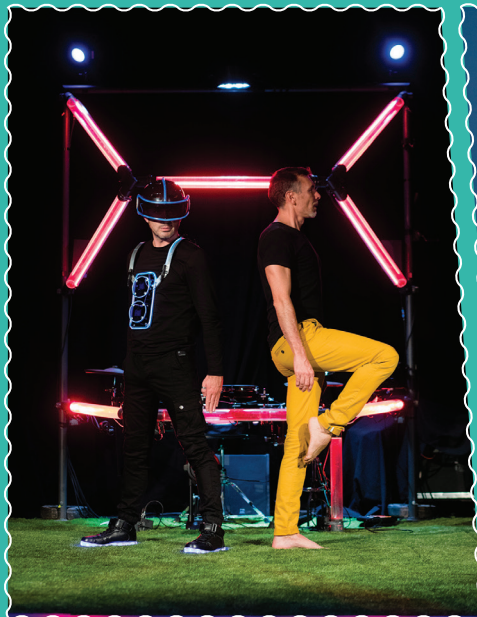
À la Ferme d'en Haut, Le disco des oiseaux