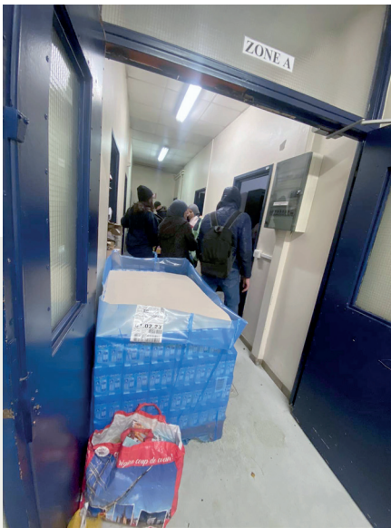
Lors d'une vente organisée au nouveau local du Secours populaire.

la Banque alimentaire du Nord. Les bénévoles proposent également une aide aux démarches administratives.