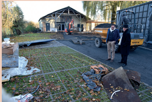
À l'arrière du bâtiment, Quanta innove avec le premier « phyto parking » en France.

En quoi consistent-ils ? « Il s'agit d'agrandir pour un espace de travail plus ergonomique, sécurisé ». Une nouvelle cuisine est aménagée. Le mur de l'estaminet côté pelouse est abattu, la salle est prolongée d'une nouvelle, avec une