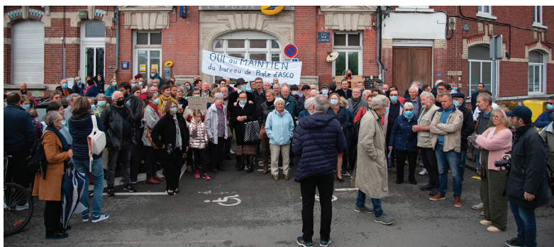
En octobre 2021, les Villeneuvois manifestaient contre la fermeture du bureau de Poste d'Ascq.

Fin mars 2023, ces nouvelles « agences postales communales », comme le prévoit la Convention signée avec La Poste, seront ouvertes au public du mardi au samedi de 8h30 à 12h.