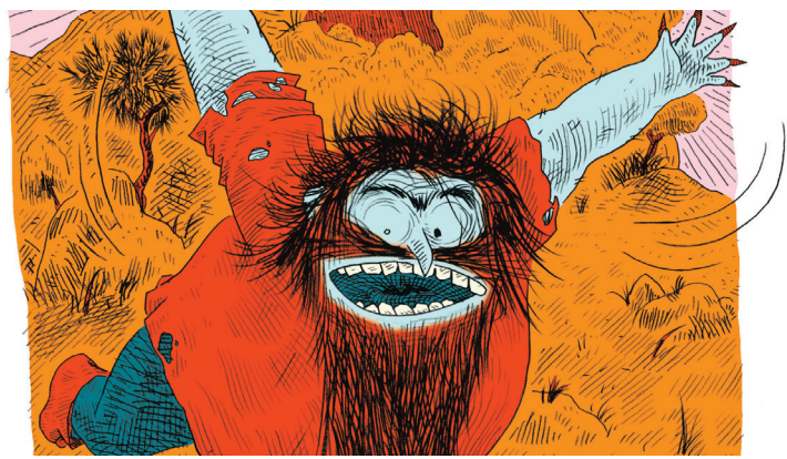
L'ogre de Gaétan Dorémus, extrait du livre « Dans les dents, une vie d'ogre » publié chez Actes sud junior.

- Des heures du conte. À 10h15, les plus petits jusqu'à 4 ans frémiront aux histoires et comptines habitées de loups, ours et monstres aussi méchants... qu'attachants.