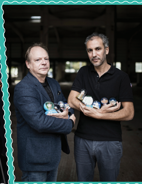
Du 2 au 4 février Boule à neige