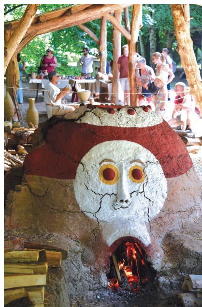
Les céramiques seront cuites dans le four d'Asnapio.

Infos : 03 20 43 55 75, ot@villeneuedascq-tourisme.eu ou openagenda.com/office-de-tourisme-de-villeneuve-d-ascq Infos : asnapio.villeneuedascq.fr