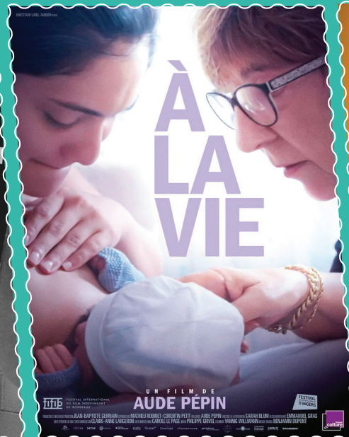
À la médiathèque le 6 mai.