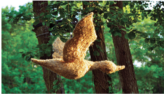
Une des œuvres de Virginie Morel...