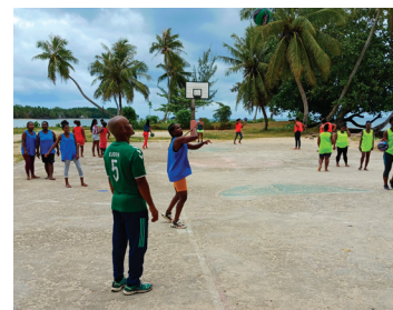
À Sainte-Marie, les jeunes femmes à l'entraînement

L'objectif de l'opération « Paniers gagnants au féminin » : permettre à des jeunes filles exclues de l'emploi et sorties du système scolaire de Tanguiéta au Bénin et de Sainte-Marie à Madagascar, d'accéder à la pratique du sport collectif et plus particulièrement du basket, avec pour relais les associations Artisanat solidarité Nord Bénin - Nord de France et Dina Mada (cette dernière est née au