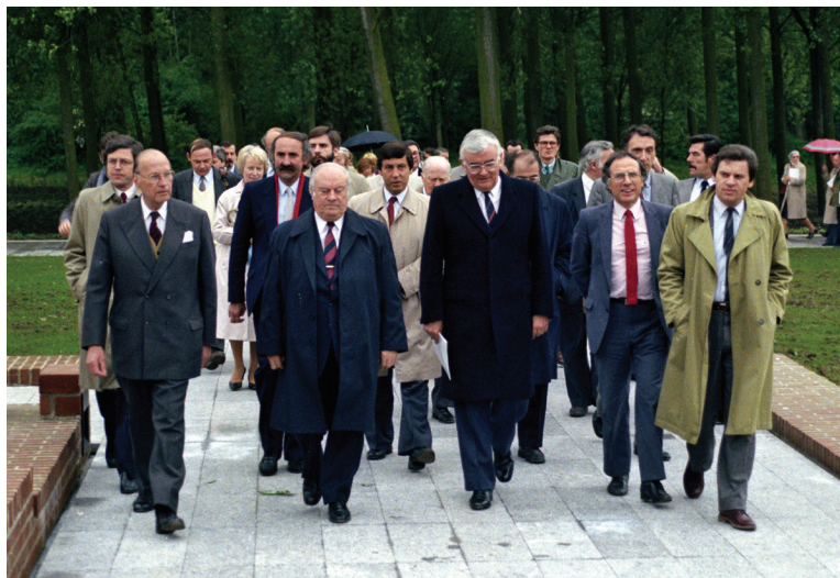
Lors de l'ouverture du Musée d'Art Moderne, en mai 1983.

Ambitieux dans sa programmation, le LaM a toujours à cœur d'émouvoir et de stimuler notre curiosité, à travers des expos, mais aussi des ateliers, des rencontres, des spectacles... Bref, un vrai lieu d'émerveillement, dont on soufflera les 40 bougies les samedi 23 et dimanche 24 mai.