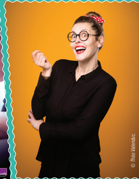
À la Ferme en haut les 14 et 15 avril L'enfer, c'est vous.