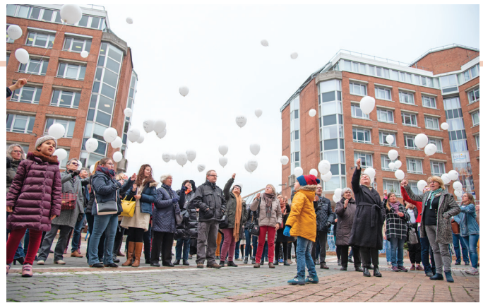
Le 25 novembre 2019, lors d'un lâcher de ballons symbolique contre les violences faites aux femmes organisé par l'association avec la Ville.

Depuis début janvier 2023, l'association n'assurait plus ses