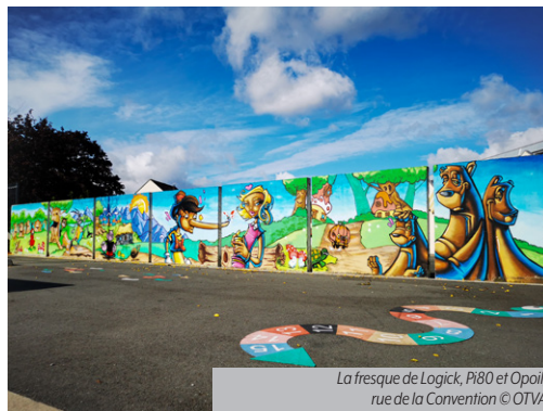
La fresque de Logick, Pi80 et Opoil, rue de la Convention

Réservation au 03 20 43 55 75 ou villeneuve-dascq-tourisme.eu/billetterie.html