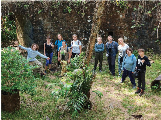
Une découverte de Madagascar pour plusieurs jeunes du collège Claudel.

L'occasion de dresser aussi un bilan personnel, d'étudier les chemins à emprunter... Sur un itinéraire très peu souvent linéaire.