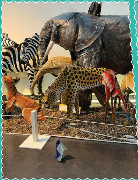
« De papier et de foin »