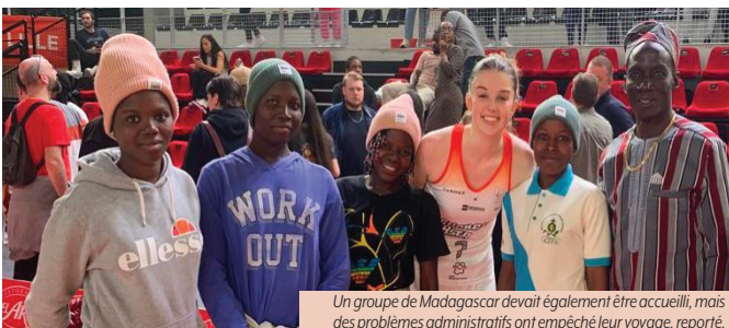
Un groupe de Madagascar devait également être accueilli, mais des problèmes administratifs ont empêché leur voyage, reporté.