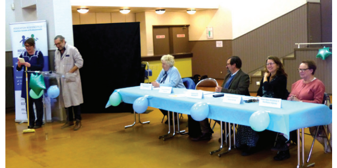
Des comédiens de la Belle histoire animaient cette AG pas comme les autres...