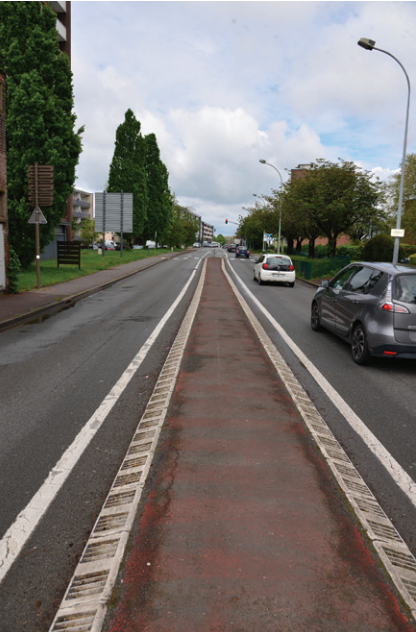
Rue Marcel-Bouderiez, il manquait un tronçon de piste cyclable...

La Mel poursuit le maillage d'aménagements cyclables, en étroite concertation avec la Ville et en lien avec l'Association droit au vélo (Adav), qui aide à définir les points noirs et les priorités. Un chantier finit, d'autres débutent cet été.