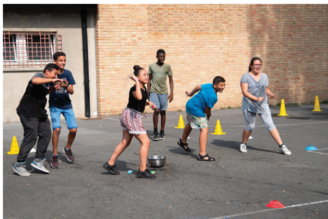
Au Cal Dorémi, sports et loisirs pour développer le vivre ensemble.