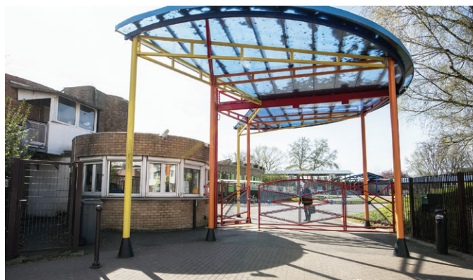
L'association de prévention tient aussi des permanences au collège du Triolo.

Infos : Avance, 53/2/3 rue Yves-Decugis, tél. 03 20 91 06 73 et avance59@orange.fr