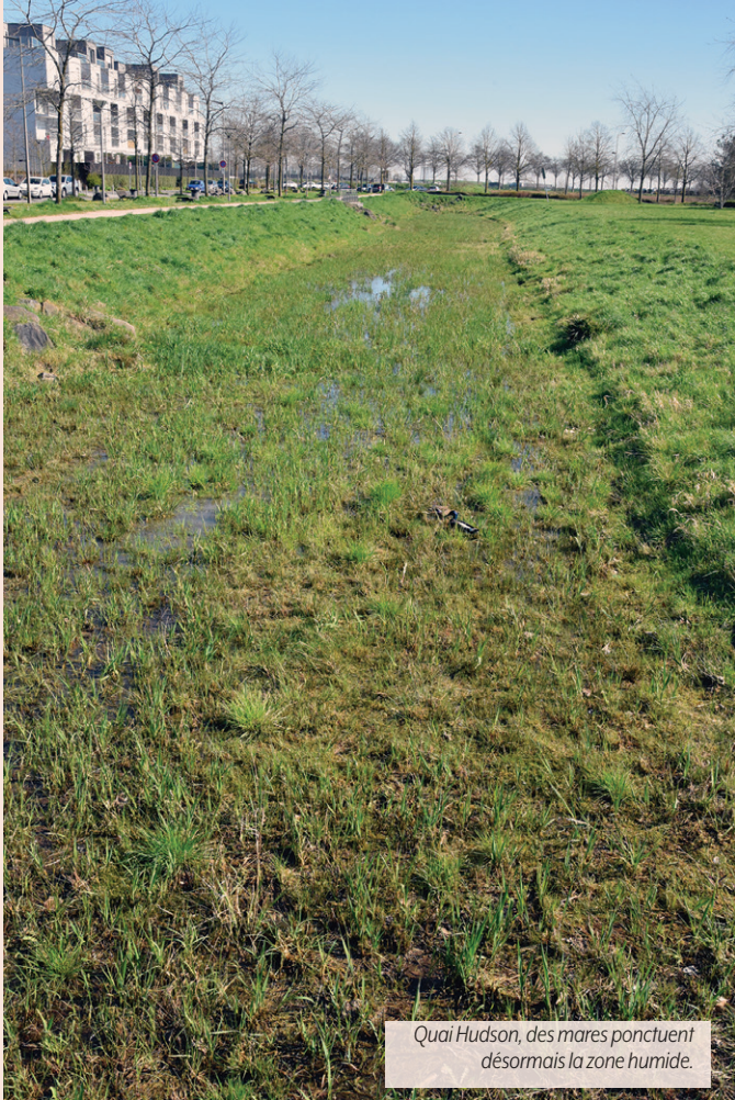
Quai Hudson, des mares ponctuent désormais la zone humide.

Pour se promener dans des coins de nature préservée, on pense plutôt spontanément au parc du Héron et à la chaîne des lacs ou, tout au nord, au Bois de Warwamme. Et pourtant, c'est à une balade à la Haute-Borne que l'on vous invite. Car la Ville, poursuivant son programme de renaturation de ses espaces, y mène des actions emblématiques de sa volonté d'encourager la biodiversité, partout où cela est possible.