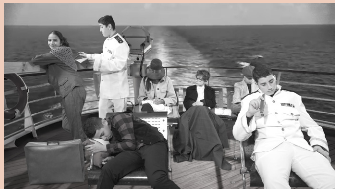
Les jeunes, derrière et devant la caméra, ont expérimenté la magie du fond vert...