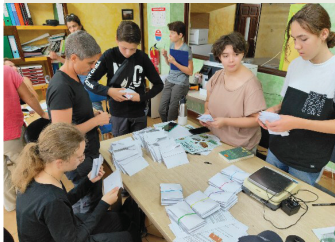
Des actions de prévention sont fréquemment menées dans les établissements scolaires.

Plus d'infos : service Prévention et promotion de la santé, rue Pasteur (Annappes), tél. 03 20 43 50 50 et villeneuve-dascq.fr