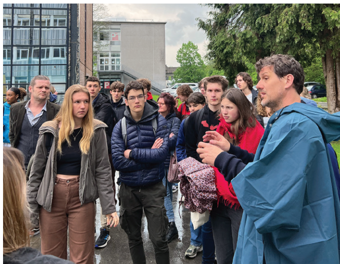
Les lycéens de Raymond-Queneau et des jeunes des maisons de quartier ont été invités à assister au tournage.

Le film est tourné essentiellement dans les Hauts-de-France, dont une vingtaine de jours à Villeneuve d'Ascq. Mais avant ça, bien avant, la production vient repérer les lieux intéressants. C'est là que la Ville intervient et notamment le service Protocole, manifestation et sécurité, pour vérifier la faisabilité de l'occupation de ces espaces publics, conseiller, orienter,