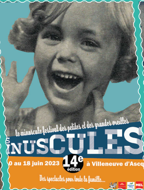
« Les Minuscules »