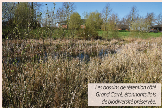
Les bassins de rétention côté Grand Carré, étonnants îlots de biodiversité préservée.

« Nous avons constaté que la végétation du premier de ces