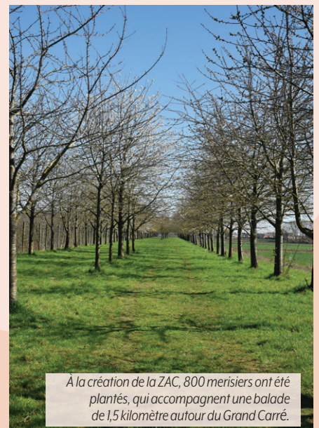
À la création de la ZAC, 800 merisiers ont été plantés, qui accompagnent une balade de 1,5 kilomètre autour du Grand Carré.