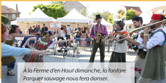
À la Ferme d'en Haut dimanche, la fanfare Parquet sauvage nous fera danser.