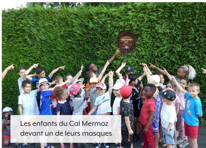
Les enfants du Cal Mermoz devant un de leurs masques