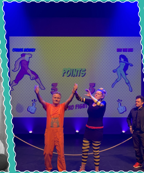
Le 7 octobre à la Ferme d'en Haut, "Lille Impro"