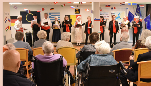
Ehpad Moulin d'Ascq

Citons encore l' accueil de jour La Ménie qui, depuis 2005, reçoit en journée au Breucq jusqu'à 12 personnes atteintes de la maladie d'Alzheimer ou apparentée. Une infirmière, des auxiliaires de soins et un psychologue orchestrent de nombreuses activités ludiques et thérapeutiques destinées à stimuler les fonctions cognitives et physiques et favoriser la socialisation : jardinage, ateliers artistiques, bricolage, promenades... La structure offre également aux proches aidants un temps de répit.