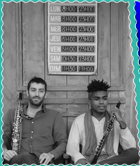
Le 8 octobre à la Ferme d'en Haut, "NoSaxNoClar"