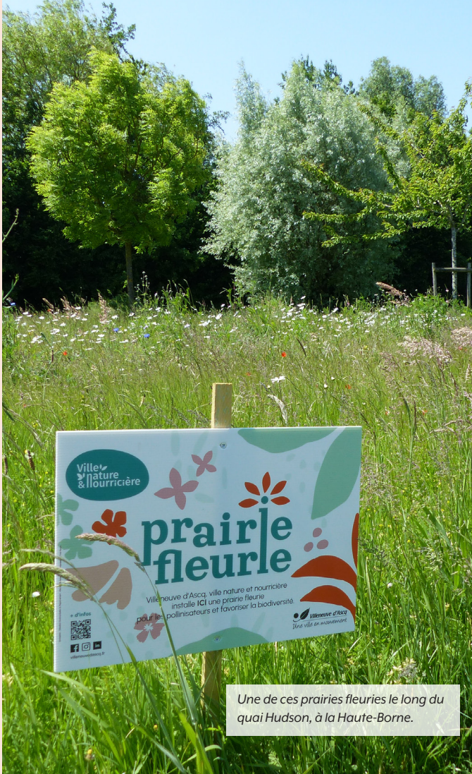
Une de ces prairies fleuries le long du quai Hudson, à la Haute-Borne.

Depuis trois ans, sous l'impulsion du maire en lien avec Yohan Tison, conseiller municipal délégué à la Gestion des espaces verts, des espaces forestiers et de la biodiversité, la surface qu'elles occupent est passée de 6 500 à 13 050 m 2 , en plus de 40 lieux différents, plus ou moins étendus.