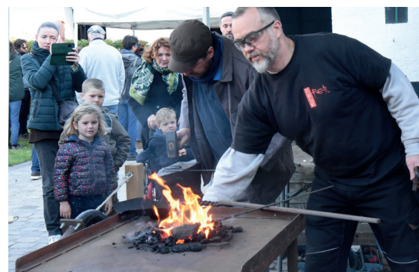
Au Musée du Terroir en novembre, le travail du fer à l'honneur. Le site fait revivre des métiers traditionnels, une de ses vocations

d'Annappes, la pompe à eau en fonte, à côté du Musée, pourrait être davantage mise en valeur au sein du chartil réhabilité avec un nouveau parcours d'exposition. Tous ces objets témoins d'hier vivent, à travers des ateliers de sensibilisation aux métiers d'autrefois, comme celui de tisseur, pour les scolaires ou pour tous lors des vacances, ou encore lors des dimanches d'animations gratuites.