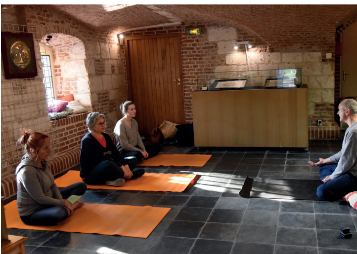
Une autre manière de faire vivre le patrimoine : une séance de yoga, lors de l'exposition dédiée à l'art sacré, le printemps dernier au château de Flers.

Pour mieux partager et faire vivre son patrimoine culturel, la Ville a depuis quelques années pris l'initiative d'ouvrir gratuitement les portes de ses musées un dimanche chaque mois, avec dans certains des animations autour de thèmes toujours renouvelés. Autant de rendez-vous à retrouver dans nos pages... Depuis le début de cette année, les structures municipales culturelles sont également ouvertes à la réservation et aux paiements (de spectacles, festivités, stages, visites...) avec le Pass culture, de manière individuelle pour les lycéens, et de manière collective pour les enseignant.e.s de collèges et lycées. Et puis, outre les Journées du Patrimoine, l'autre grand rendez-vous de la culture approche à grand pas : la Nuit européenne des musées, le samedi 18 mai, dont le programme est encore en construction, mais avec encore à n'en pas douter de nouvelles manières d'appréhender lieux et collections, à travers concerts et spectacles, visites thématiques, projections, performances... « Votre curiosité n'est pas prête d'être rassasiée ! Du moins je l'espère » termine Dominique Furne.