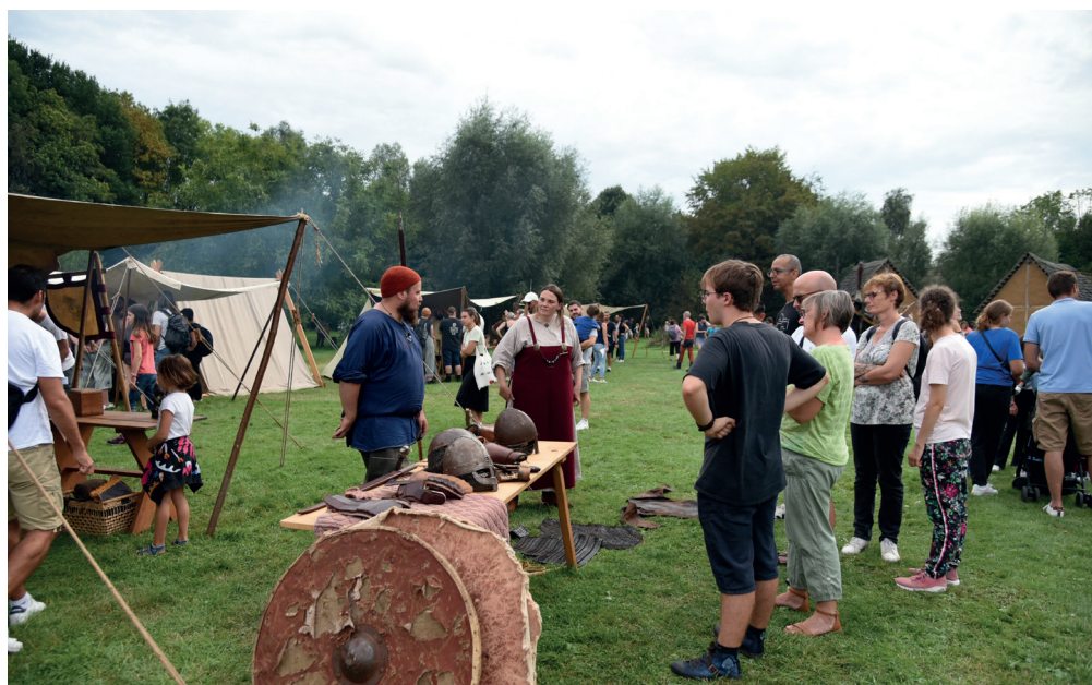
Lors des Journées du patrimoine 2023, les Vikings à l'honneur.

Infos et inscriptions : rue Carpeaux ; tél. 03 20 47 21 99 ; asnapio.villeneuedascq.fr