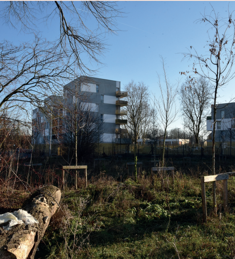
En plein environnement urbain, la nature va s'épanouir pleinement.

C'est un modeste terrain au Pont-de-Bois, entre l'arrière des récents immeubles de l'avenue Baudoin-IX et celui du lycée Queneau, non loin de la toute aussi récente école Joséphine-Baker. Un lopin jusqu'alors sans vocation particulière, dont la propriété se partage entre la Ville, la Mel et Partenord Habitat. Un espace dont le potentiel écologique, au cœur d'un milieu urbain rénové, n'a pas échappé à la Ville... Par une convention, les « clefs » symboliques des lieux lui ont donc été confiées par le bailleur, avec l'engagement d'y créer une zone refuge pour la biodiversité, clôturée pour éviter tout passage humain. Seuls de petits trous discrets dans le grillage, au sol, ont été prévus pour permettre aux petits animaux de circuler librement. Sur moins d'un hectare, autour du vénérable tilleul préservé, la plupart des principes piliers de la ville nature et nourricière est appliquée... Mais d'abord, il a fallu déminéraliser, là où demeuraient les restes goudronnés du parking des Bacheliers et de la base du chantier de construction de l'école, et apporter de la bonne terre. Les eaux pluviales peuvent ainsi non plus rester en surface, mais pénétrer le sol. Pour améliorer le drainage, un réseau de noues (petit fossés) permettra à l'eau de s'écouler vers une mare, bientôt creusée au point le plus bas.