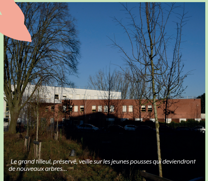
Le grand tilleul, préservé, veille sur les jeunes pousses qui deviendront de nouveaux arbres...

Qui dit zone urbaine dit éclairage public, nécessaire, mais susceptible de gêner la vie nocturne et le sommeil de la faune. Là encore, la solution est dans le végétal : quand les arbres vont pousser, non seulement ils vont contribuer à abaisser de leur ombre portée la température aux alentours -les fameux îlots de fraîcheur-, mais un pin sylvestre va rapidement pousser et tamiser la lumière artificielle, pile dans l'axe du lampadaire. Avec le même principe et les mêmes objectifs, dont lutter contre l'artificialisation des sols, d'autres lieux de biodiversité préservée sont en projet : non loin de là, sur deux parcelles le long de l'avenue du Pont-de-Bois, au Sart près de l'école La Fontaine, à Ascq au bout de la rue Joffre... Nous y reviendrons !