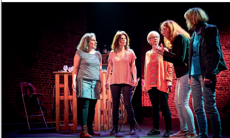
Le Théâtre d'à côté est l'un des principaux « locataires » de la grange. Notre photo : l'une de ses récentes créations, « Nous, Vous, Elles ».

Au Triolo, la Ferme Dupire, une de celles restaurées et sauvées lors de la création de la ville, rassemble la « grange », salle de spectacle, et la galerie Gilbert-Sailly, toutes deux proposées à la location pour recevoir des manifestations culturelles ouvertes au public. Elles ne sont pas privatisables. La salle n'étant pas insonorisée, elle n'accueille pas de concerts. C'est là que, depuis 1992, l'association Le théâtre d'à côté déroule ses saisons, mais elle n'est pas la seule à y brûler les planches.