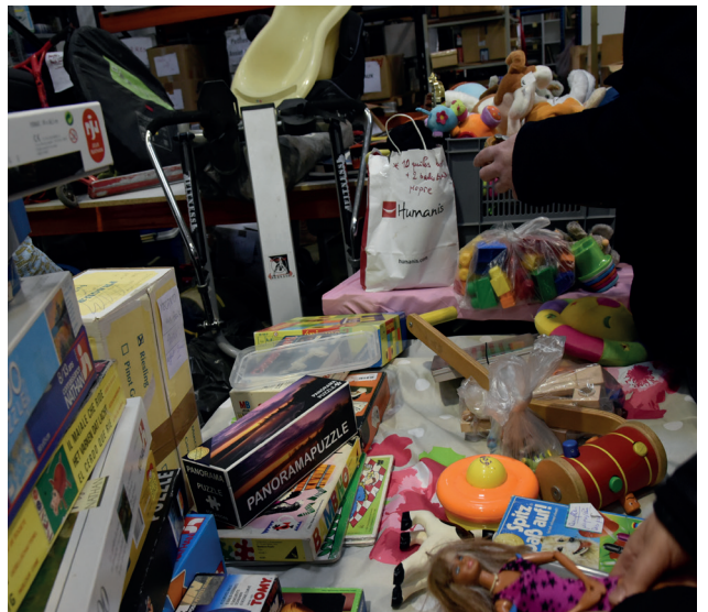
À la Ressourcerie de l'Abej, les objets, meubles, vêtements... réparés, nettoyés, customisés, sont synonymes d'insertion. Infos : pointdecollecte_uaportail@outlook.fr et https://uaportail.fr/

Infos et réservation au 06 08 93 19 26 ou sur villeneuveascq-tourisme.eu/billetterie.html