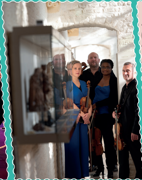
A la ferme d'en Haut le 18 février, le quatuor Sirius.