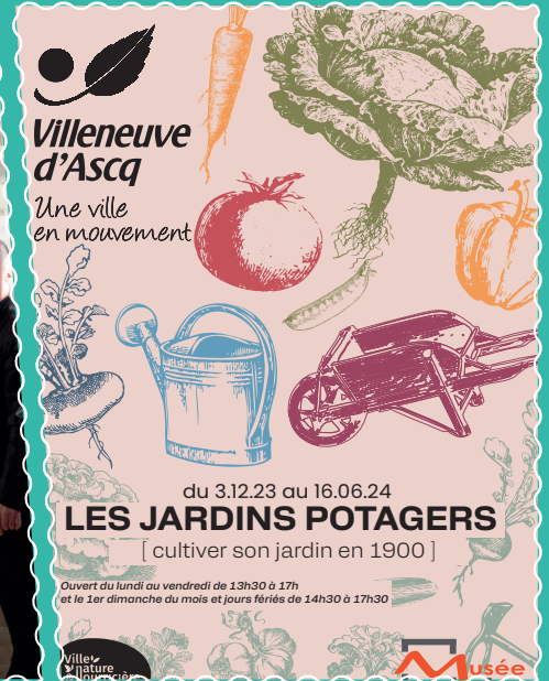
Au Musée du Terroir jusque juin, Bête comme chou