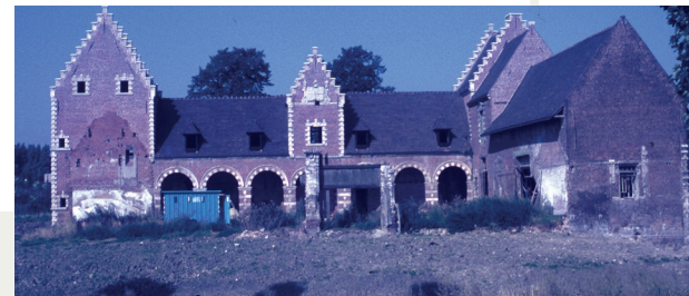
Le château vers 1975, avant sa rénovation... Côte 7F3117.

Le chantier est à nouveau confié à Maurice Salembier. En 1986-1987, les soubassements sont réhabilités, les sous-sols recrusés puis aménagés. Le pont est reconstruit, avec ses deux arches de grès et un plancher à la place du pont-levis. Portail métallique, chemin pavé, salle de réception dans l'aile droite, quatre salles de musée en sous-sol : le château devient celui que l'on connaît aujourd'hui. Où l'on peut acheter, à l'Office de tourisme, l'image de la bâtisse telle qu'elle apparaissait dans les albums de Croy, en 1603, reproduite sur des mugs, des puzzles ou des magnets... La boucle est bouclée.