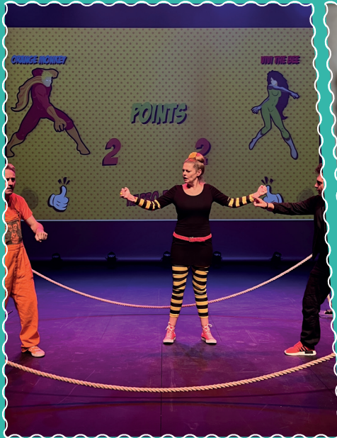
A la Ferme d'en Haut le 16 février, Improfight