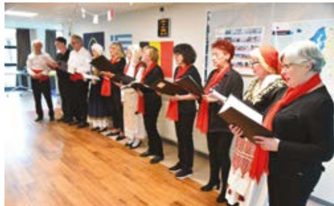
Chanter, c'est aussi un moyen de garder la forme ! ici, la chorale des aînés en concert à l'Ehpad du Moulin-d'Ascq.

Infos et inscription : Maison des Aînés, 2 rue de la Station ou en ligne, via le site Internet de la Ville, villeneuedascq.fr/bienvieillir