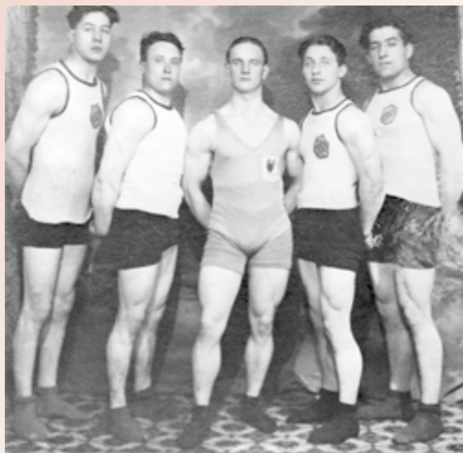
Au centre, Léon Vandeputte, haltérophile, qui s'est illustré lors des JO de 1924 à Paris.