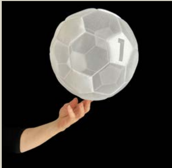
Lentille par Angélique

Places limitées, inscriptions au 03 20 61 01 46