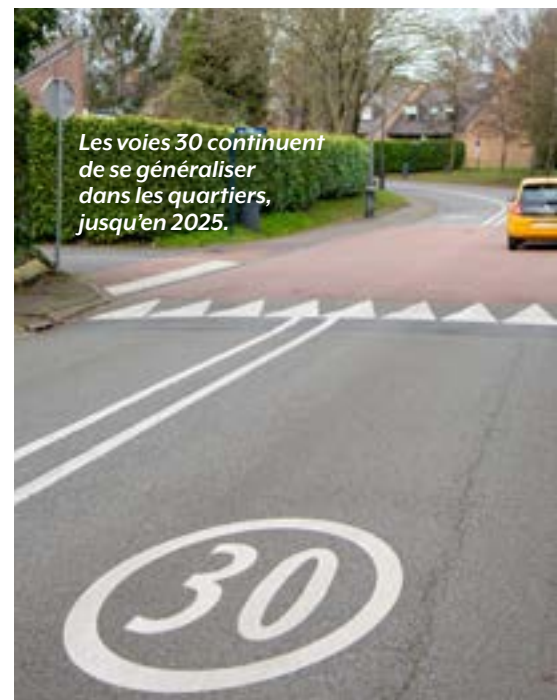
Les voies 30 continuent de se généraliser dans les quartiers, jusqu'en 2025.