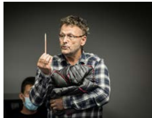
Toutes les choses géniales, à 15h.

Plus d'infos : villeneuveascalq.fr/decheteries-et-encombrants et lillemetropole.fr/decheteries-mobiles