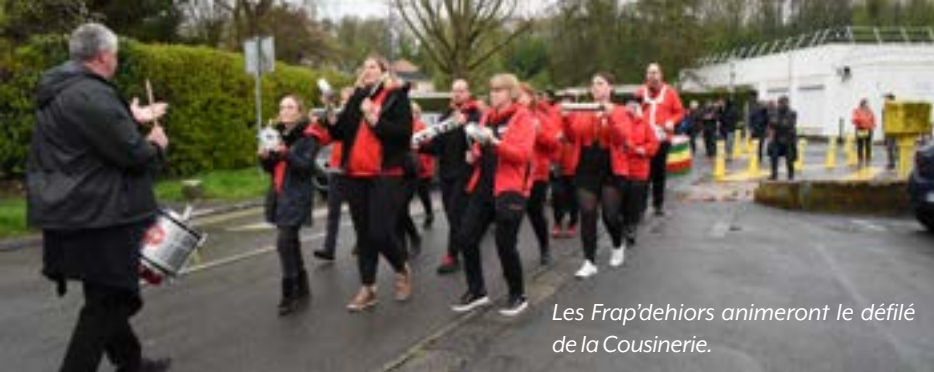
Les Frap'dehiors animeront le défilé de la Cousinerie.