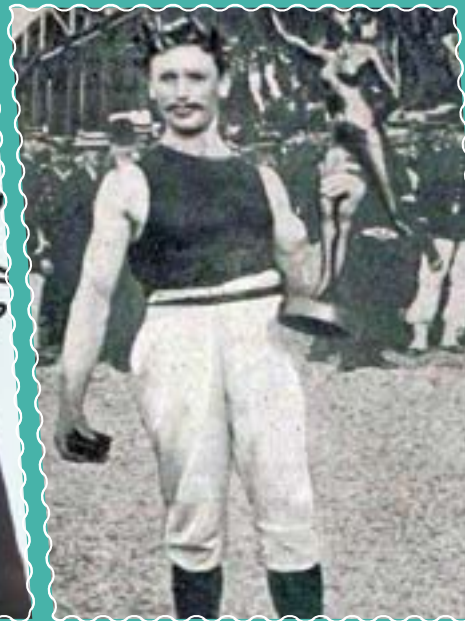
Du 13 au 19 avril au Château de Flers, Zoom sur les olympiens villeneuvois