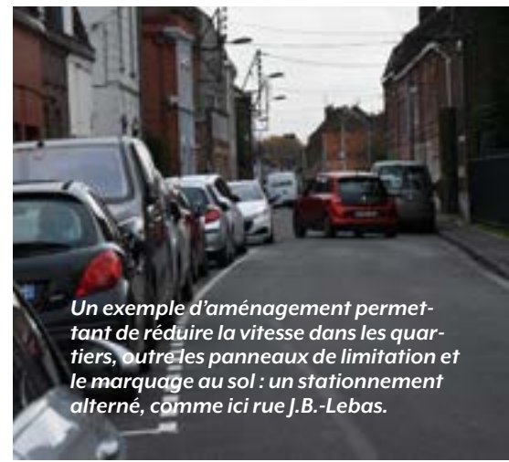
Un exemple d'aménagement permettant de réduire la vitesse dans les quartiers, outre les panneaux de limitation et le marquage au sol : un stationnement alterné, comme ici rue J.B.-Lebas.

Programme des ateliers vélos organisés par la Ville : villeneuve-dascq.fr/se-deplacer-velo-villeneuve-dascq