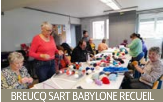
BREUCQ SART BABYLONE RECUEIL