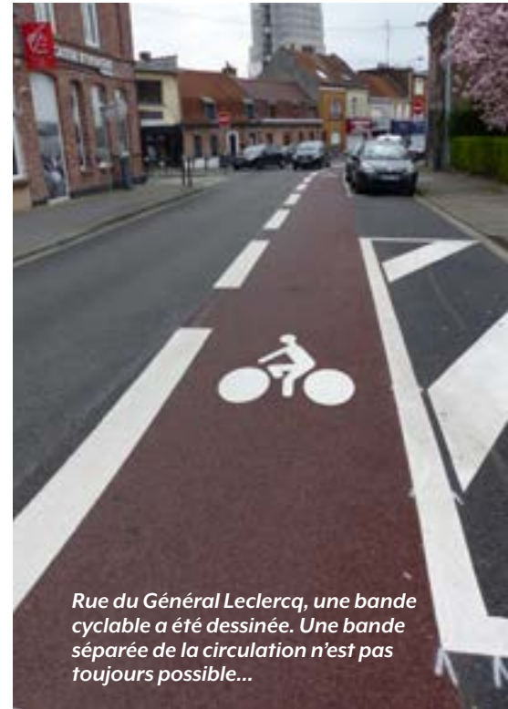
Rue du Général Leclercq, une bande cyclable a été dessinée. Une bande séparée de la circulation n'est pas toujours possible...