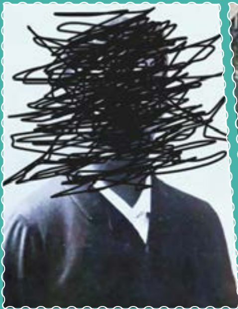
Le 12 avril À la ferme Dupire, Le Horla