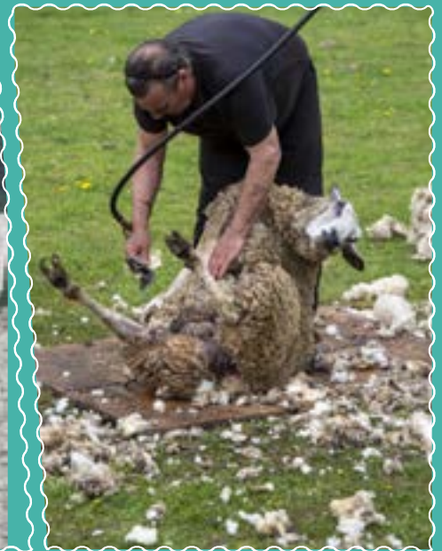
Le 1 er mai au Musée de Plein air, Tonds ton mouton