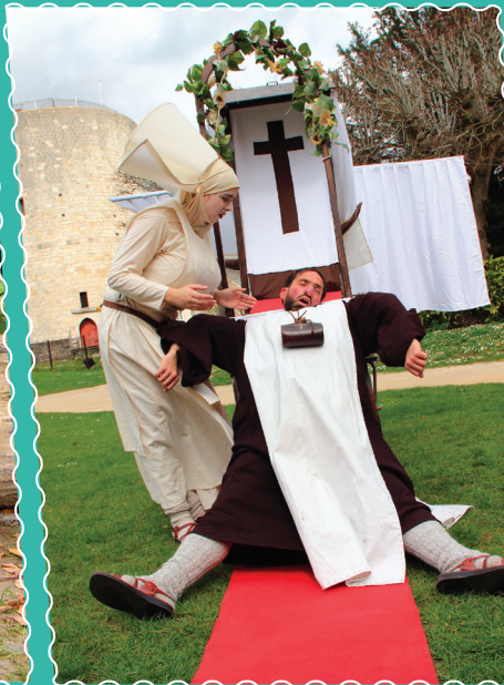
Asnapio le 13 octobre.