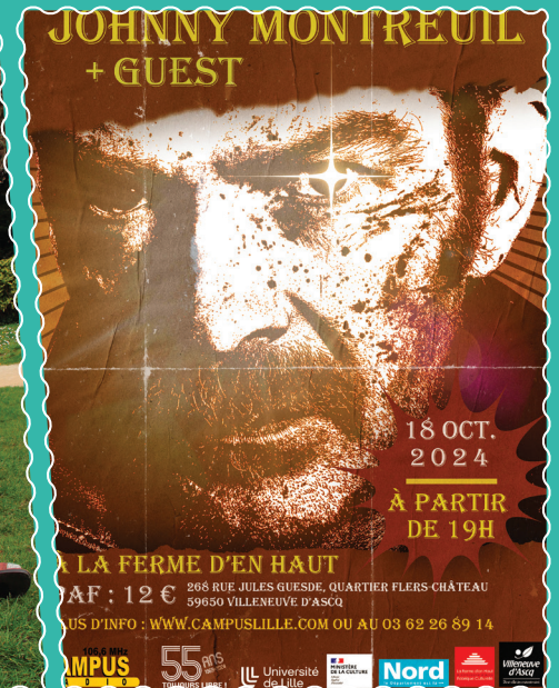
À la ferme en haut le 18 octobre