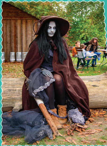
Les 12 et 13 octobre Au Musée de Plein air, la Fête de la sorcière