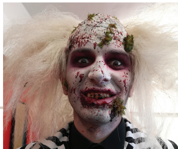
L'an dernier, les Villeneuvoises ont imaginé et créé leur portrait en papiers découpés

Une balade « Nature fais-moi peur » : avec le service Développement durable, mercredi 30