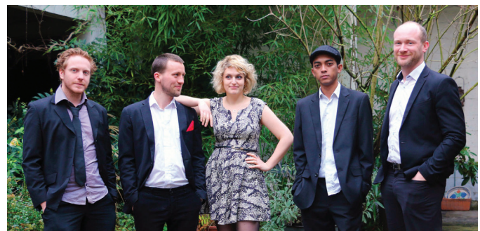
Venez danser avec Swing my baby

Fabriquez votre marque-pages. De 15h30 à 17h, customisez votre marque-page inspiré de l'univers fantastique de l'auteur. Ados/adultes.