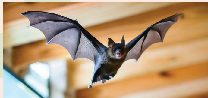
La chauve-souris pipistrelle ont besoin d'obscurité. Dommage, car elles raffolent des moustiques. Eteignez donc, la nuit, guirlande et petites lampes solaires pourant « tendance »...

Certaines zones nécessitent une attention particulière. Il s'agit de la chaîne des lacs ou encore du Forum Vert. Ces espaces sont autant de véritables refuges pour la faune et la flore,