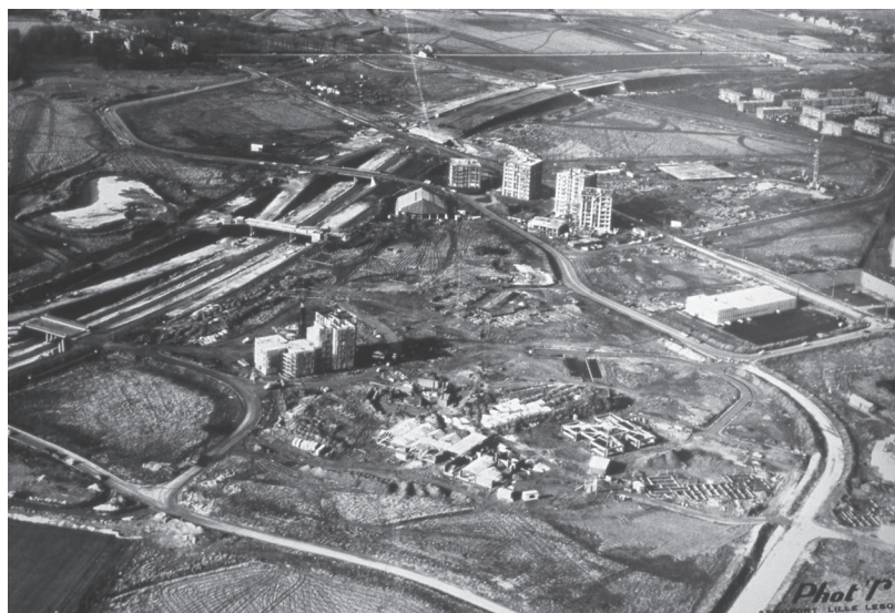
Vue aérienne prise en février 1973, Triolo ouest, la construction des logements Chapel (groupe Citées et jardins) et du groupe scolaire Taine.

Mais au fait, pourquoi ce nom ? Les hypothèses sont aussi nombreuses qu'incertaines. L'une d'elle renvoie à la mention « Tréola » aux côtés de la ferme d'Annappes, retrouvée dans les manuscrits du temps de