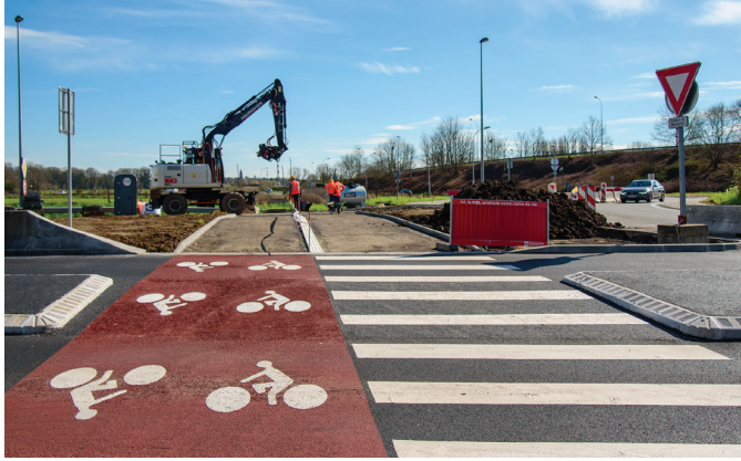
Rue de Lannoy