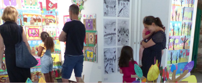
L'exposition des travaux était visible au début de l'été à l'Atelier 2.