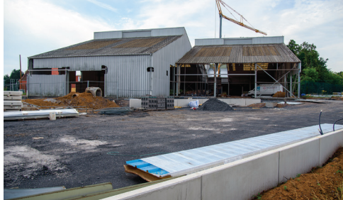
Le complexe Fos Tennis