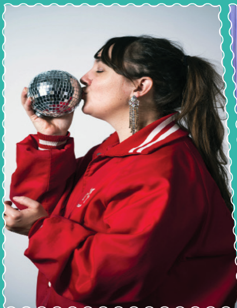
Le 14 septembre, à la Médiathèque "Et toi tu as toujours rêvé d'être "pompom girl"