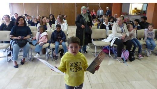
Lors de la mise à l'honneur des jeunes élèves, le 13 juin à l'hôtel de ville. Chacun a reçu un diplôme et un livre.

L'info en plus : chaque année, six classes bénéficient ainsi du dispositif des classes artistiques de la Ville.