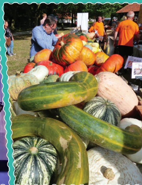
Les 5 et 6 octobre, au musée de plein air fête de la citrouille