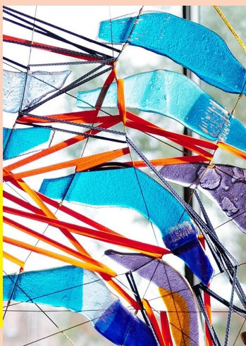
Détail d'une œuvre de Fabienne Decornet.

Du 21 septembre au 9 mars 2025, du lundi au vendredi, et le 2 e dimanche du mois et jours fériés de 14h30 à 17h30. Entrée et ateliers gratuits. Possibilité de visite guidée pour les groupes, contact: museechateau-flers@villeneuedascq.fr