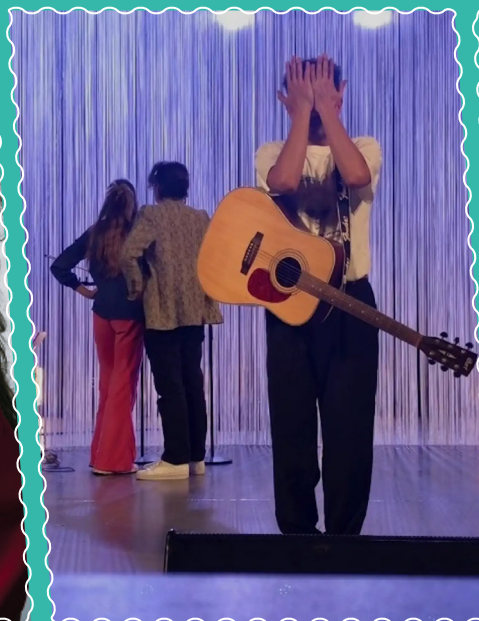
Du 3 au 5 octobre, à la ferme d'en haut. Neiges éternelles Photo.cie il faut toujours finir ce qu'on a commencé