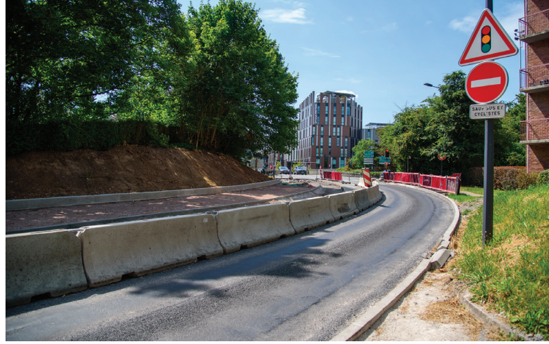
Rue des Techniques

Entre le rond-point de Roubaix et l'entrée de Hempempont, seule la voie verte est éclairée par un éclairage « autonome » alimenté par des panneaux photovoltaïques et équipé de détecteur de présence.