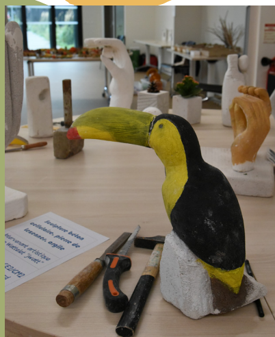
Les centres sociaux (ici, celui du Centre-Ville) exposent également les créations de leurs adhérents.

Infos et liste des artistes qui exposent courant septembre sur poaa@le-nord.fr et sur villeneuve-dascq.fr