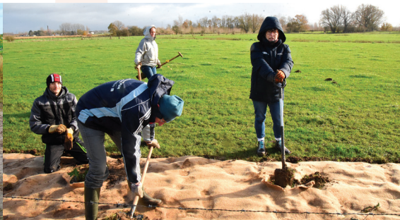
Création d'une haie