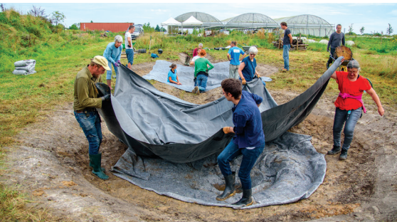
Création d'une mare