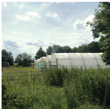
© Alban - Serres de la Ferme Planche