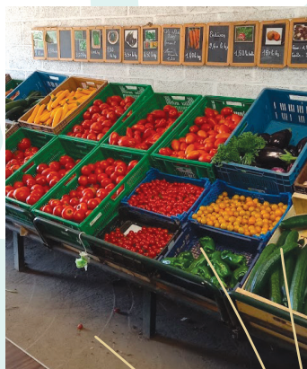
P'tit marché Delebecque