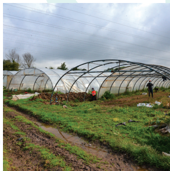
Les Serres des Prés