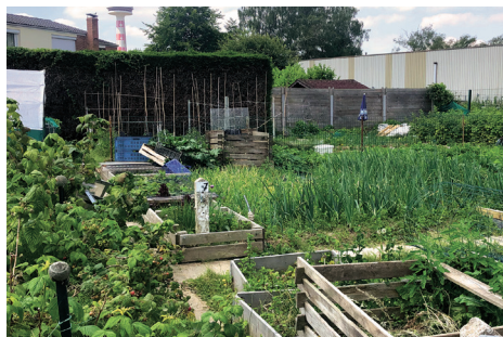
Jardins familiaux Jacques Brouillard

Jardins Partagés : l' Association pour la Promotion de la citoyenneté (APC) développe et anime avec la ville plus de 12 jardins partagés dans les différents quartiers. https://apcvilleneuveascalq.fr