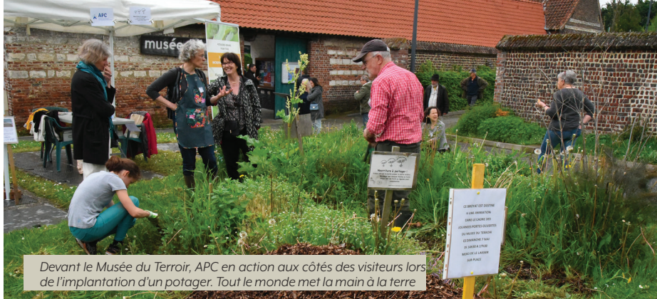
Devant le Musée du Terroir, APC en action aux côtés des visiteurs lors de l'implantation d'un potager. Tout le monde met la main à la terre

L'association contribue également à l'organisation d'animations et d'ateliers, ainsi qu'à la mise en réseau des jardins et des habitants.