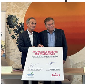
La convention de partenariat entre la Ville et la mutuelle Just a été signée à l'Hôtel de Ville le mercredi 9 octobre.

tants en facilitant l'accès à une complémentaire santé de qualité, pour les personnes qui le souhaitent et à un tarif accessible, afin de renforcer la solidarité, d'améliorer l'accès à la santé et d'augmenter le pouvoir d'achat des adhérents.