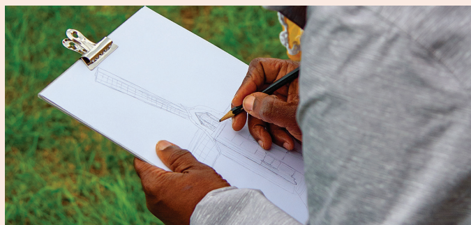
Le 30 novembre, dessinez la nature !

Inscriptions : villeneuedascq.fr , rubrique « Agenda du Développement Durable »