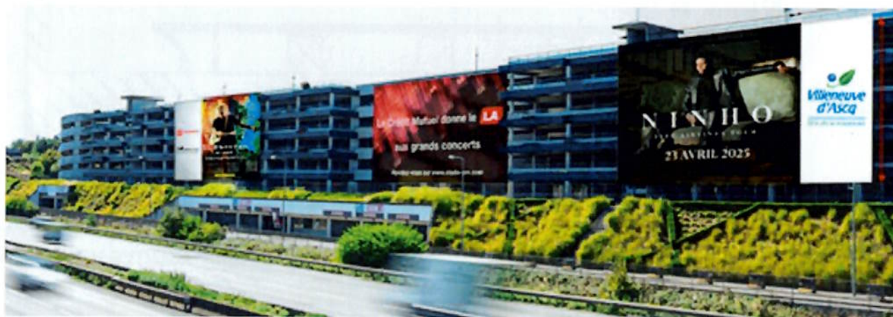
Simulation visuelle avec dispositifs (Exemple de gauche à droite : MEL – Ed Sheeran – Crédit Mutuel – Ninho – VDA)