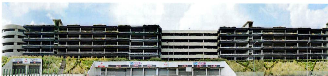
Simulation visuelle sans dispositif