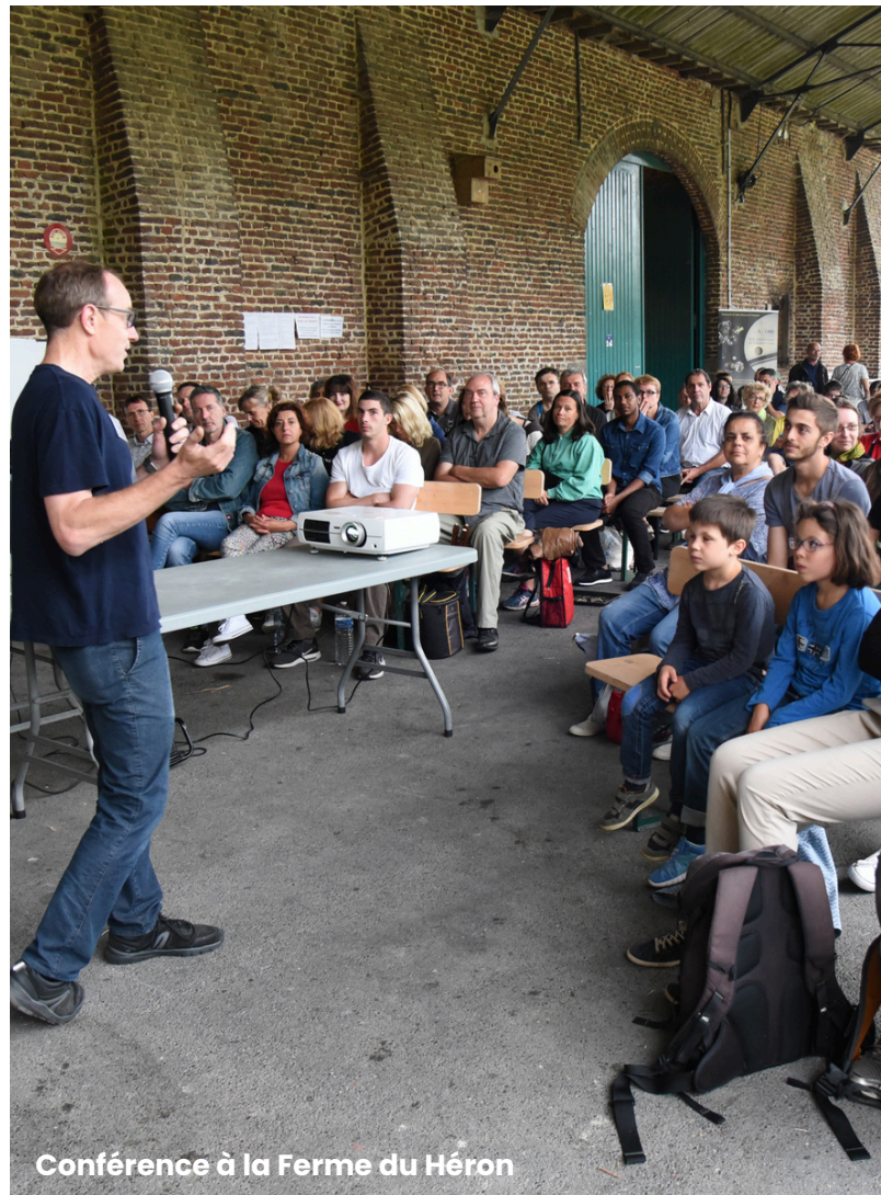
Conférence à la Ferme du Héron