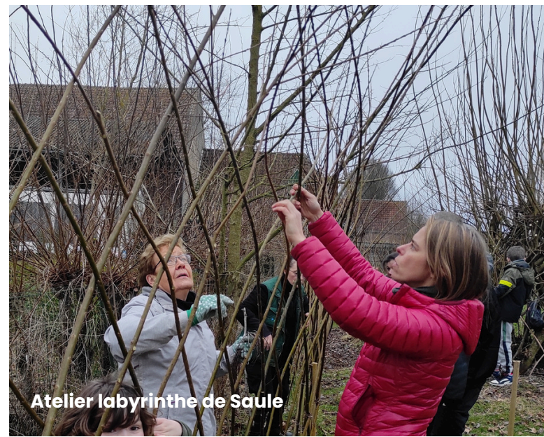
Atelier labyrinthe de Saule